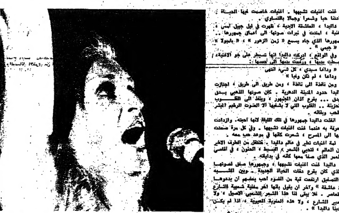
ما هي ابيدي من زيموجديد